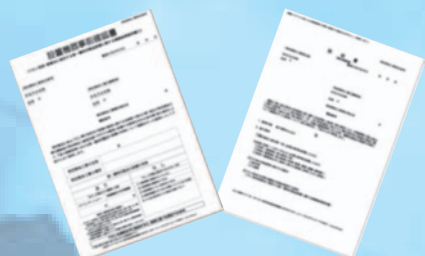
設置機器事前確認書