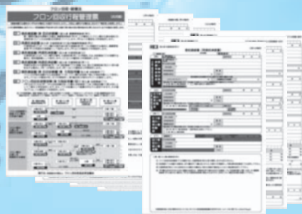
行程管理票(汎用版)